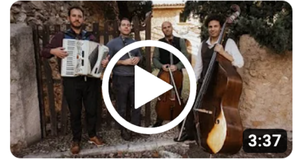
Circus - Baba Ganoush Quartet