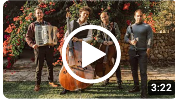
I tant que sí - Baba Ganoush Quartet