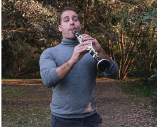
TOLO GENESTAR CLARINET CLARINET

Cursa estudis superiors de clarinet al Conservatori Superior del Liceu de Barcelona i Conservatori de Niça (França) acabant amb les màximes qualificacions per unanimitat del jurat.