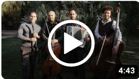
Festa Jueva - Baba Ganoush Quartet